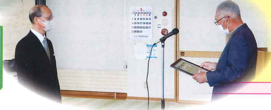
当日出席された 会員・役員の 表彰風景