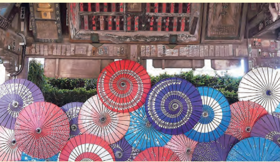
「笠間稲荷神社絵馬殿」

新年あけましておめでとうございます。 皆様におかれましては、お健やかに新年をお迎えのこととお慶び申し上げます。 日頃から、市民の皆様をはじめ、笠間市、各企業の皆様方には、当シルバー人材センターの運営等に対しまして、格別なご支援とご協力を賜り、厚く御礼を申し上げます。 さて、シルバー人材センターにおいては、「自主」「自立」「共働」「共助」の理念のもと、地域に密着した就業機会を提供することにより、高齢者の社会参加を促進し、生きがいの充実、健康維持の増進を目指し、ひいては地域社会の活性化や生涯現役社会実現の担い手として日々邁進しておりますが、年金支給年齢の引き上げに伴う雇用制度の変化等により、入会する会員が減少傾向にあることから、一部の作業に