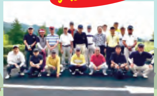
石岡ウエストカントリークラブ