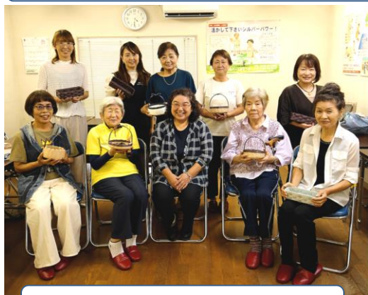
手芸講習会 9月26日(木)