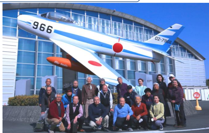
令和5年度視察研修会 写真左：浜松城 写真右：航空自衛隊浜松広報館エアパーク 2月14日(水)