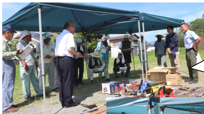
草刈り講習会 7月29日(月)