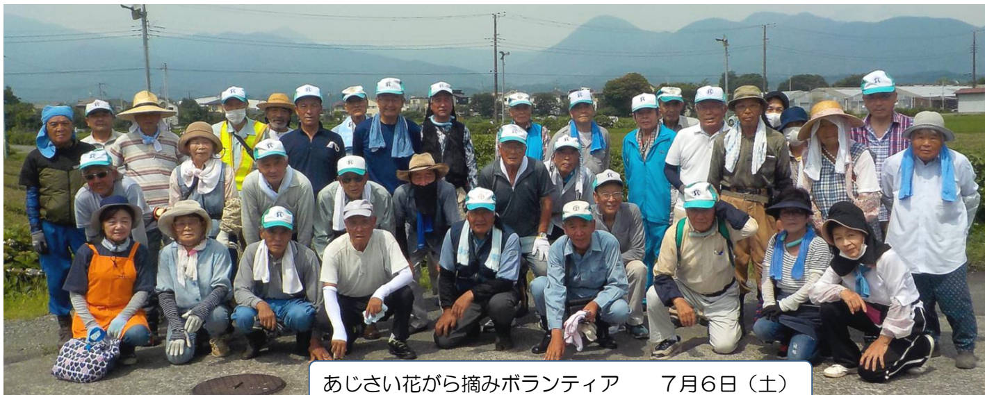
あじさい花から摘みボランティア 7月6日(土)