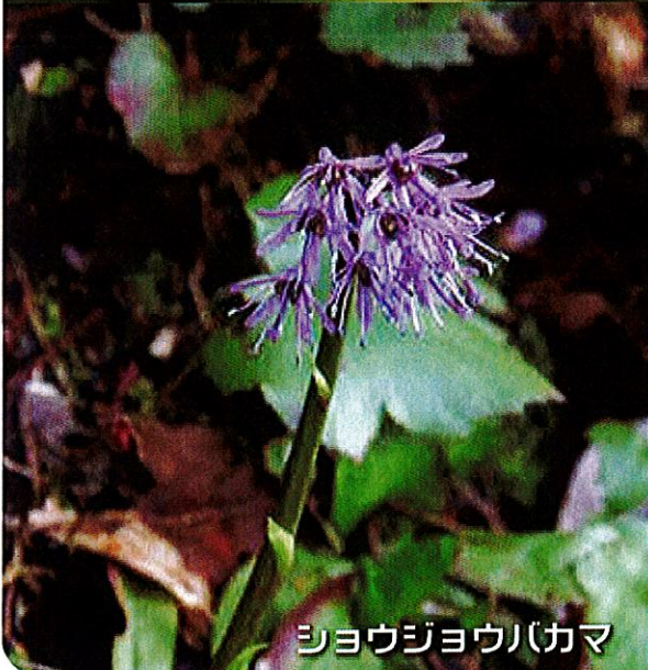
シヨウジョウバカマ