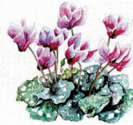
シクラメン 花言葉：憧れ