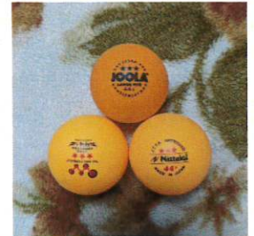
ラージボール公認試合球

ラージボール卓球を高齢者卓球と馬鹿にしていた自分はDランクからのスタートですが、今ではラージボール卓球の魅力から抜け出せずにはいます。これからも体力を維持し、シルバー人材センターからの請負業務を続けながら、合間合間に、夢の「Aランク」を目指しこのスポーツを続けていければと思っているこの頃です。