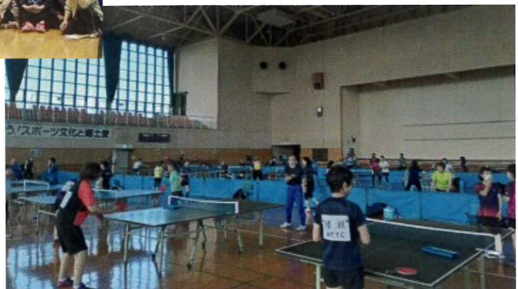
試合前の練習風景（館林）