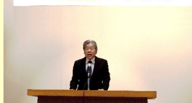
公益社団法人 杉戸町シルバー人材センター 令和7年度 定時総会